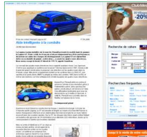
Esempio di redazionale AUTO